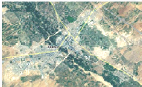
شکل ۲- تصویر ماهواره ای ابهر

ابه‌ر، دومین شهر استان زنجان بعد از مرکز آن است و در ۸۳ کیلومتری جنوب شرقی زنجان و ۷۸ کیلومتری غرب قزوین قرار دارد، فاصله آن تا تهران حدود ۲۴۰ کیلومتر می‌باشد و در مسیر آزادراه شمال غرب کشور واقع شده است. این شهر به عنوان مرکز شهرستان ابهر، در ۳۶ درجه و ۸ دقیقه عرض شمالی و ۴۹ درجه و ۱۳ دقیقه طول شرقی واقع شده است و ارتفاع متوسط آن از سطح دریا ۱۵۴۰ متر است (معصومی ۱۳۸۴: ۵۶). ابهر مساحتی در حدود ۱۵۸۱ هکتار را دربر می‌گیرد و مساحت باغات و اراضی زراعی حدود ۳۳ درصد از مساحت کل آن را شامل می‌شود (مهندسین مشاور آرمان شهر ۱۳۸۹: ۳۳). پیرامون شهر را نیز باغات فراگرفته‌اند شکل (۲). به استناد گزارش جهاد کشاورزی ابهر مساحت باغات شهری و پیراشهری آن کلاً حدود ۱۹۵۰ هکتار می‌باشد.