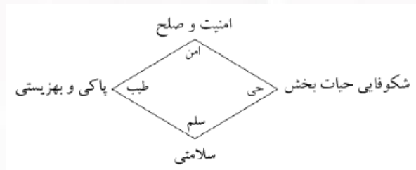
شکل ۱- ویژگی‌های اساسی شهر اسلامی